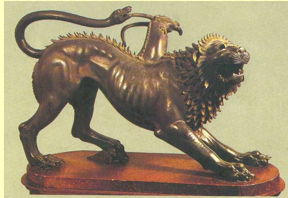
Etrušćanska bronca VI st. pr. n. e