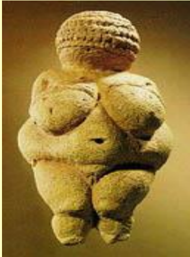
"Willendorfska Venera", oko 25.000 – 20.000 pr.n.e. Willendorf, Austrija