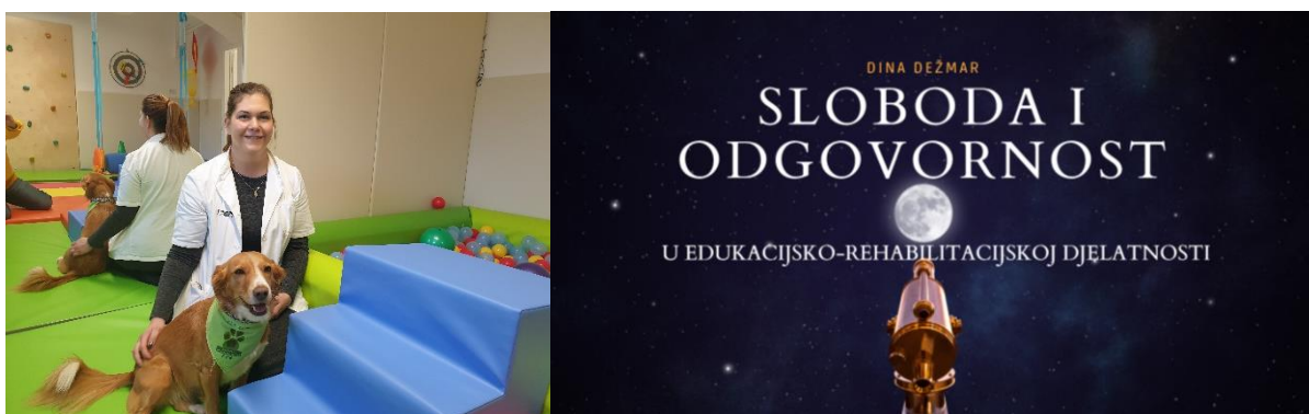
Slika 1 i 2. Dina Dežmar na radnom mjestu u Specijalnoj bolnici „Martin Horvat“ i naslovnica pozvanog predavanja

U završnom dijelu Skupštine, naša alumna Dina Dežmar održala je pozvano predavanje na temu Sloboda i odgovornost u kojem je prikazala svoj profesionalni razvojni put, svu ljepotu i izazove zanimanja edukacijski rehabilitator koje pokriva široko područje djelovanja, zahtjeva veliki raspon kompetencija - interdisciplinarnih znanja, vještina i razumijevanja, ne samo o znanstvenim spoznajama i načelima edukacijsko-rehabilitacijske znanosti, već i o međuljudskim odnosima, etičkim vrijednostima i stavovima koje svaki edukacijski rehabilitator razvija i nosi u sebi. Na početku profesionalne karijere alumna Dina Dežmar je radila u području obrazovanja djece s većim teškoćama u razvoju da bi nakon sedamnaest godina prepoznala poziv tima za ranu intervenciju Specijalne bolnice za ortopediju i rehabilitaciju „Martin Horvat“ u Rovinju gdje i danas radi kao članica stručnog tima na poslovima rane intervencije u edukacijskoj rehabilitaciji. Radeći u različitim sustavima naučila je kako svaki čine ljudi koji svojim profesionalnim i odgovornim djelovanjem „mogu doprinijeti potrebnim pozitivnim promjenama kod ciljane populacije i okruženja te da ljepota slobode i lepeze djelovanja edukacijskog rehabilitatora nosi i veliku odgovornost, ne samo u području osobnog djelovanja, već i struke u cjelini“.