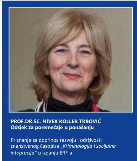
SLIKA 13: Priznanje za razvoj i održivost znanstvenih časopisa ERF-a