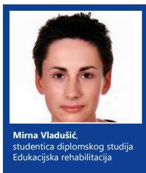
SLIKA 4: Posebna dekanova nagrada članicama grupe REHOOV