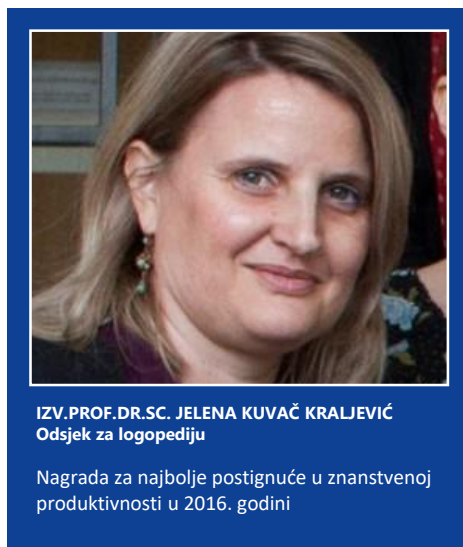
SLIKA 14: Nagrada za ERF-a za znanstveni rad