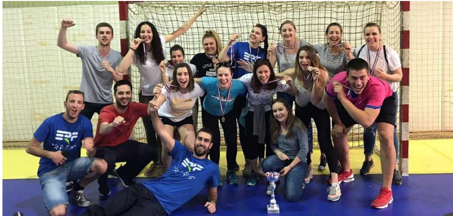
Slika 10: Ženska rukometna ekipa osvojila srebrnu medalju na Sveučilišnom prvenstvu Zagreba