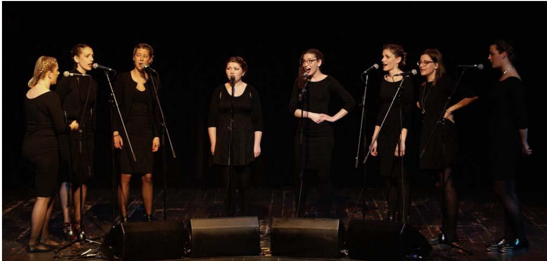
Slika 12: Klapa Sorelo pobjednik 5. Festivala studentskih klapa

Studentice Edukacijsko-rehabilitacijskog fakulteta, članice klape Sorelo, apsolutne su pobjednice 5. Festivala studentskih klapa osvojivši prvo mjesto i nagradu publike.