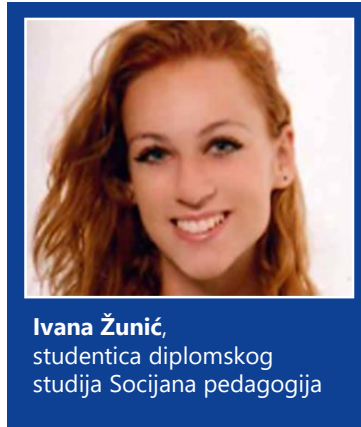
SLIKA 3: Priznanje za najuspješniju volonterku

Dodijeljene su i Posebne dekanove nagrade članicama grupe studenata REHOOV za aktivnu organizaciju niza događanja i promicanja suradničkog rada studenata ERF-a: