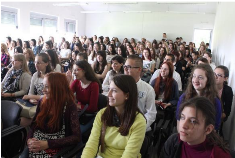
SLIKA 1: Uvodno predavanje (ak. god. 2014./2015.)

Tablica 3. pokazuje brojčane podatke vezane uz upis na preddiplomske, a Tablica 4. na diplomatske studije.