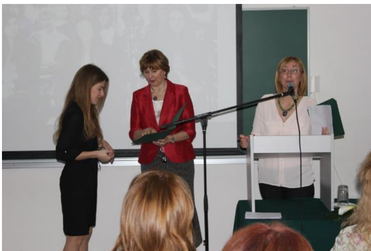
SLIKA 2: Dodjela nagrada i priznanja studentima ERF-a