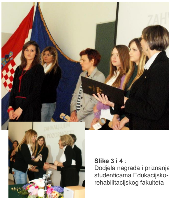
Slike 3 i 4 : Dodjela nagrada i priznanja studenticama Edukacijsko-rehabilitacijskog fakulteta

Ovom nagradom, Edukacijsko-rehabilitacijski fakultet, želi omogućiti podizanje razine svijesti o važnosti i korisnosti volontiranja među djelatnicima i studentima te dati priznanje volonterskom angažmanu studenata.