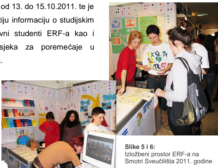
Slike 5 i 6: Izložbeni prostor ERF-a na Smotri Sveučilišta 2011. godine

Smotra Sveučilišta je održana od 13. do 15.10.2011. te je Fakultet dobio Priznanje za najcjelovitiju informaciju o studijskim programima. Na Smotri su bili aktivni studenti ERF-a kao i asistenti/znanstveni novaci sa Odsjeka za poremećaje u ponašanju i Odsjeka za oštećenje vida.