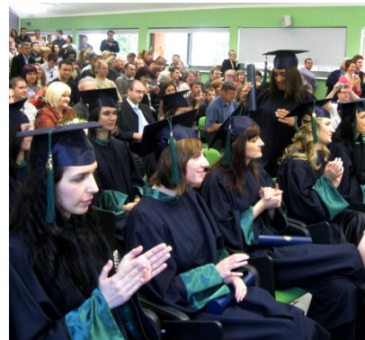
Slika 2: Svečana promocija diplomanata

Prvostupničke svjedodžbe još uvijek nisu tiskane, a tako ni diplome za magistre struke - logopedije, socijalne pedagogije i edukacijske rehabilitacije.