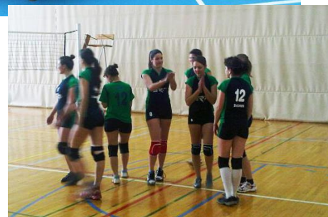
Slike 7 i 8: Nogometna i odbojkaška ekipa ERF-a