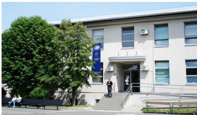
Slika 1: Zgrada Edukacijsko - rehabilitacijskog fakulteta

Edukacijsko – rehabilitacijski fakultet Sveučilišta u Zagrebu je u 2011. godini proslavio 49 godina svoga samostalnoga visokoškolskog djelovanja. Danas je to u Hrvatskoj jedina, regionalno središnja, a u području srednjeg i jugoistočnog dijela Europe i šire, prepoznata, profilirana i partnerski poželjna znanstveno istraživačka i visokoobrazovna institucija.