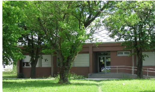
Slika 12: Zgrada Centra za rehabilitaciju

Cjelokupne aktivnosti tijekom godine su obuhvaćale sljedeće vrste rada koje su različito raspodijeljene po navedenim kabinetima: