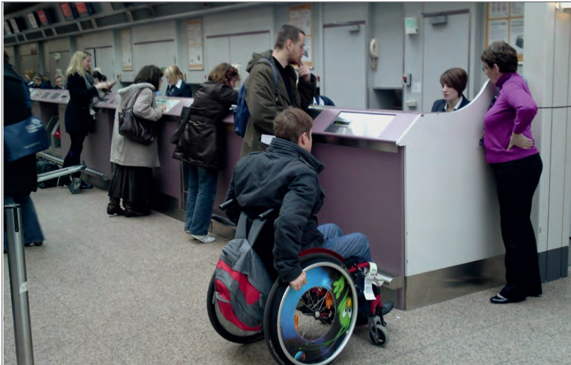
Slika 2. Fotografija prikazuje studenta s invaliditetom i njegova osobnog asistenta prilikom registracije u zračnoj luci.

Većina zračnih luka putnicima s teškoćama kretanja osigurava prednost pri registraciji te pomoć pri ukrcavanju na zrakoplov 44 .