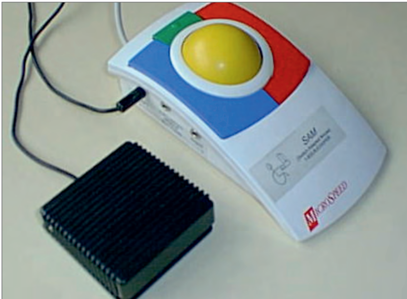
Slika 6. Alternativni oblik računalnoga miša prilagođenoga za osobe s invaliditetom

Assistive Technology Training Online (ATTO): Overview of Switch & Scanning Systems http://atto.buffalo.edu/registered/ATBasics/AdaptingComputers/SwitchInterface/index.php