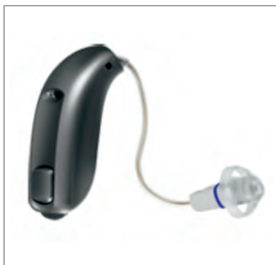
Slika 4. Slušni aparat

CODI: Cornucopia of Disability Information – Hearing Impairments http://codi.buffalo.edu/hearing.htm