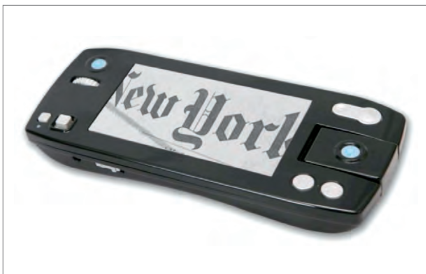
Slika 2. Prijenosno elektroničko povećalo