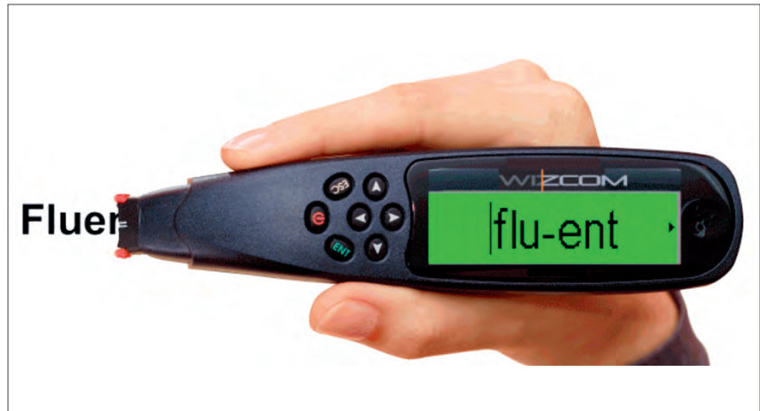
Slika 9. Olovka koja čita (Reading Pen), uređaj pogodan za osobe s disleksijom

Danas postoje gotovo neiscrpne mogućnosti korištenja različitih vrsta komunikacijske, informacijske i drugih tehnologija koje osobama s invaliditetom omogućavaju lakše uključivanje u sve segmente života, tako i u obrazovanje. Brojni su proizvođači specijalizirani za pomoćnu tehnologiju, a sve se više vodi briga o tome da i standardna tehnologija zadovolji osnovna načela pristupačnosti, odnosno da bude konstruirana na načelima univerzalnoga dizajna. Primjer za to sve su češće mogućnosti prilagodbi standardnih alata radi pristupačnosti korisnicima s različitim potrebama. Tako, primjerice, najčešće korišteni operativni sustav za osobna računala Microsoft Windows u sebi sadrži ugrađenu opciju mogućnosti uključivanja povećala za tekstualne sadržaje koji se prikazuju na zaslonu, koju kao dobru zamjenu za skupe komercijalne programe mogu koristiti slabovidne osobe. Naravno, to je