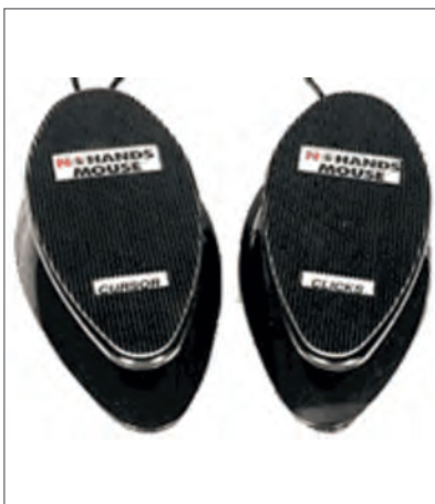
Slika 7. Računalni miš prilagođen za upravljanje nogama