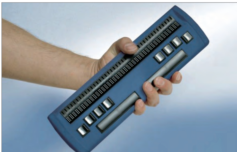
Slika 1. Brailleov redak