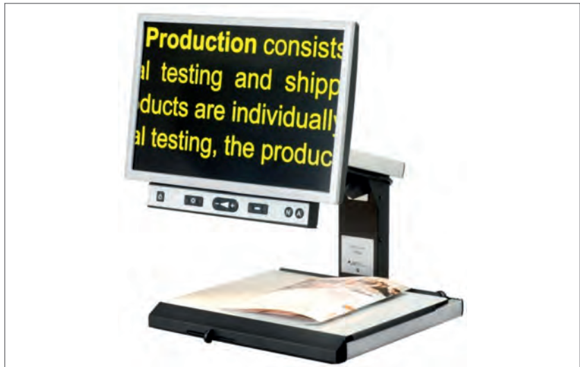
Slika 3. Elektroničko povećalo ili Closed Circuit Television (CCTV)